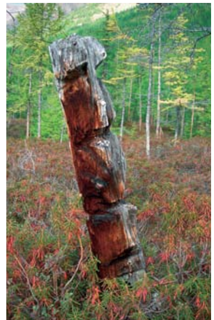
Этот эвенкийский идол стоит на корню — т. е. вырезан из ствола дерева прямо на том месте, где оно росло. Судя по выжженной солнцем стороне, ему может быть более 100 лет.